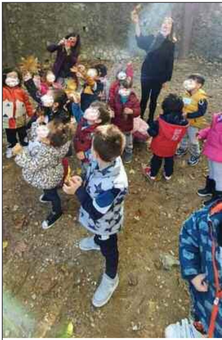
«Σχολείο μου η φύση» για τα παιδιά των Παιδικών Σταθμών μας. Τα παιδιά των Παιδικών