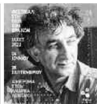
Πρόγραμμα Εκδηλώσεων Φεστιβάλ στη σκιά των Βράχων Iαχές 2022